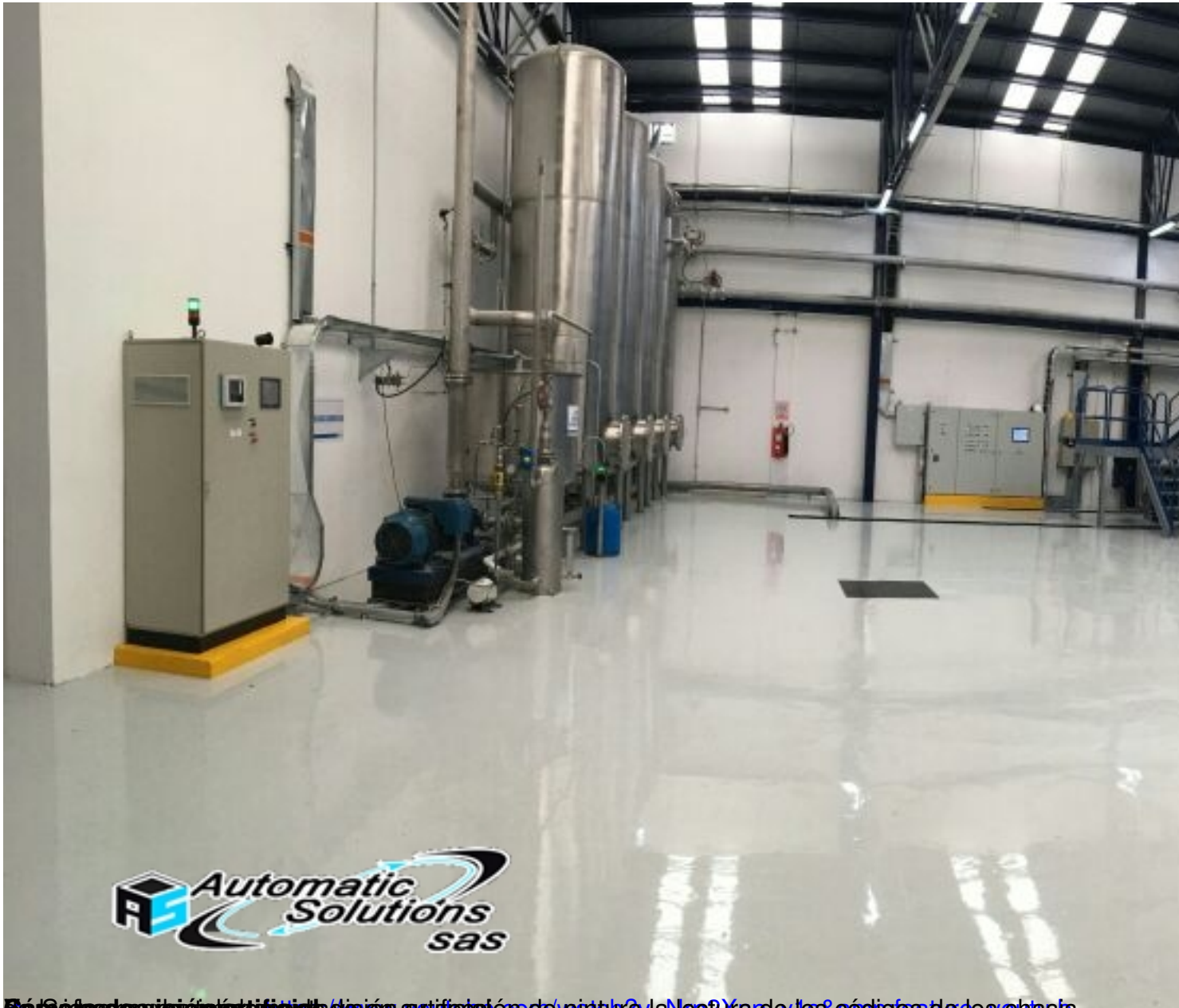
Fig. 12. Instalación de pintura automática en la planta de producción de pintura de la Neptun de los códigos de los chasis